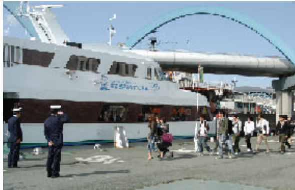
名古屋港の港務艇(なかなか豪華な船でした)に乗り込む新入生の皆さん

このうち、「名古屋港クルーズから貿易を考える」コースでは、名古屋港管理組合職員の方の案内で船で港内をクルージングしながら、取扱貨物量、貿易額日本一の名古屋港の果たしている役割に耳を傾け、最新のコンテナヤードや臨海工業地帯を海側から眺めるなど、ものづくりを支える名古屋港を実感することができました。