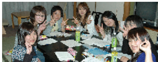
グループディスカッション

ホテルへ到着してすぐの、セミナーでは、まだ借りてきた猫のようにおとなしい新入生も、小部屋に分かれてのグループディスカッションではすつかり打ち明け、それぞれのテーマを決め他のグループにアンケートを採りに行ったり積極的に取り組んでいました。翌日のセミナーⅢで各グループの発表会を行い、ステージに上がって寸劇をするチームや、なぜかバック転のパフォーマンスをする者もいて笑いと拍手を誘っていました。