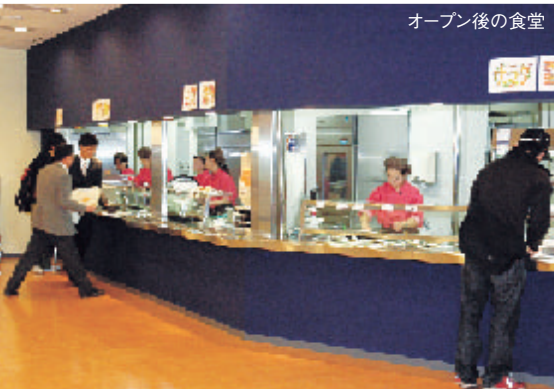
オープン後の食堂