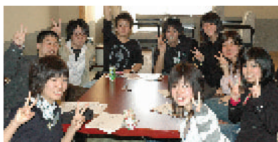
小部屋に分かれてのゲーム