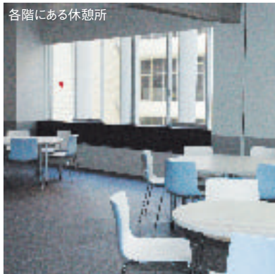
各階にある休憩所