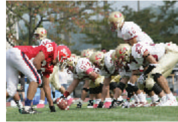
体 アメリカンフットボール部