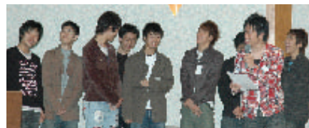
理工グループ研修結果発表会

先生になるために、私学では教員採用者が多い名城大学を選んだという学生も多く、これからの4年間で勉強だけでなく、サークル、バイト、交友など多くの経験をしたいと先輩達からのアドバイスがありました。