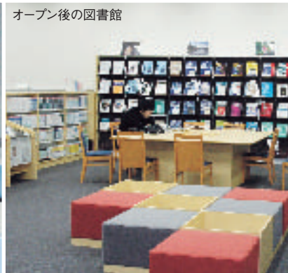
オープン後の図書館