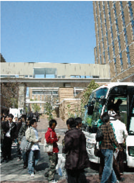
経済学部新入生歓迎会出発

新入生は、「地域の産業と古い町並み」、「金融」、「堀川と名古屋の中心部」、「環境(リサイクル関連事業所)」、「名古屋港クルーズから貿易を考える」といったコースに分かれ、この地区の経済活動を生で体験し