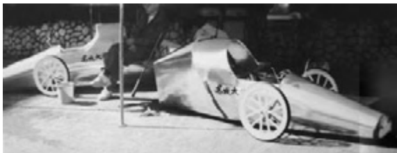
図6 学生製作の省エネカー展示

ある。省エネカーでは、「もの」そのものを取り扱い、安全に配慮して作業を行う等の作法・礼儀等も教育し、「もの」に愛着を抱くように指導している。このテーマでは、大会主催者の提唱するレギュレーションに合致する省エネカーを製作し、エンジンの熱効率を向上させる等、省燃費運転できる状態に改良している。特筆すべきことは、すべて完全なものの製作が要求されることであり、60点で合格という中途半端なものづくりではない。部品の機能発揮は当然であるが、常に他人に対する安全の配慮、壊れない事に対する強度・信頼性、ドライバーが事故を起こさないための安全性等を常に考慮した軽量設計・製作が必要である。これらが「ものづくり」に関する工学的感性・センスの育成になる。また、このテーマは環境と省エネルギー問題に対しての取り組みの教育結果として、名城大学からの情報発信の一助にもなっている。さらに、成果を高校生にアピールするため、省エネカーの展示(図6)および手作りパネル(図7)を作成して、1989年(平成元年)入試課主催の「名城大学キャンパス開放日」に当初から協力し、以来、今日の「オープンキャンパス」に引き継