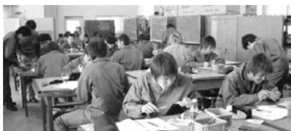
図3 テキストを読解しての遂行