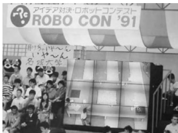
図12 第1回ロボットコンテスト(1991年)

図15、図16は製作したコンテスト用ロボットで、交通科学科(当時は、交通機械学科)の「ものづくり技術」の応用としての「車型」で「確実に動作する」ものを製作した。確実に動く物の必要性およびそれを作るノウハウは、省エネカーレースでの「完走」の経験から得られたものである。