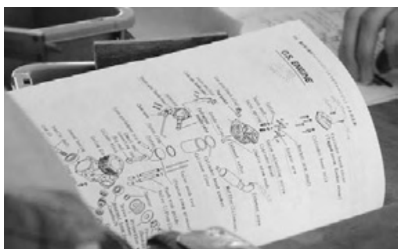
図2 テキスト内容の例