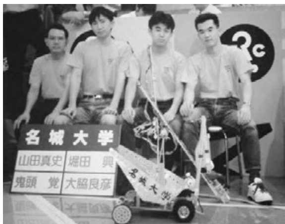
図15 第1回大会で製作の車型ロボット