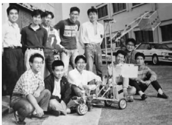
図16 第2回大会で製作の車型ロボット