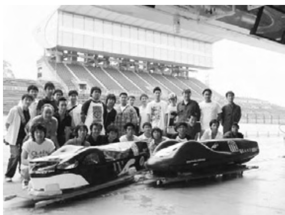
図11 2008年鈴鹿大会・大学の部優勝

持っている。「本田宗一郎杯Hondaエコノパワー燃費競技全国大会」での第25回大会(図8)では1454.5km/L、第27回大会では1629.4km/Lの記録で大学チーム1位を達成し、全国に名城大学の名声を高めている。図9、図10は学生手作りのカーボンファイバー製の車体を示しており、図9は「スーパーマイレჯカーコンテスト広島」で2136.6km/Lの記録達成のMEGV2004号、図10は1610km/Lの記録達成のNova号である。図11は2008年6月開催の鈴鹿サーキットでの大会において、雨天の中、大学の部で優勝した名城大学チームのメンバーである。