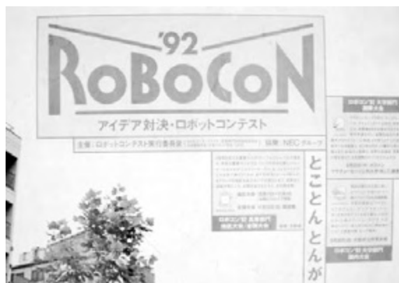
図13 第2回ロボットコンテスト(1992年)