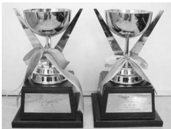
第1回 第2回 図14 第3位：技術賞