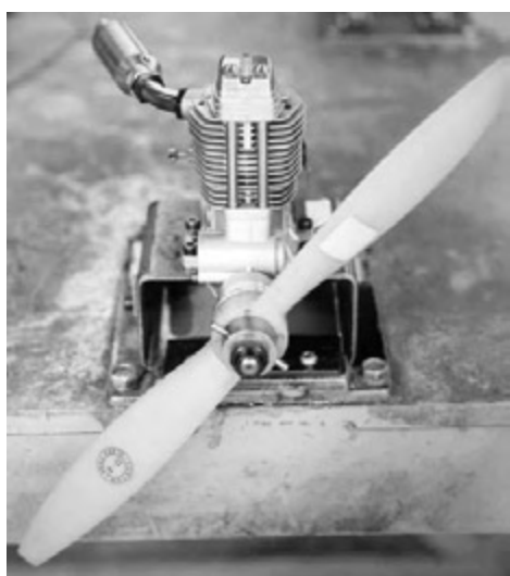
図4 プロペラ装着状態