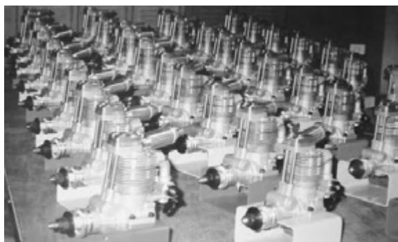
図1 教材・エンジン