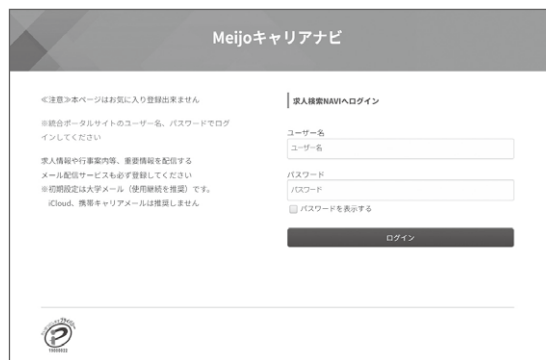
統合ポータルサイトのユーザー名、パスワードでログインしてください。