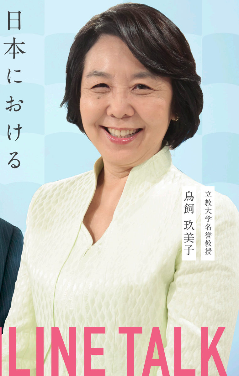
立教大学名誉教授 鳥飼 玖美子