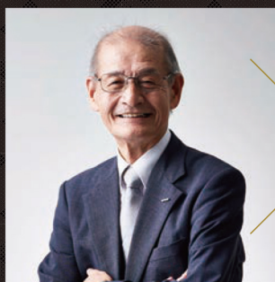
吉野 彰 名城大学終身教授