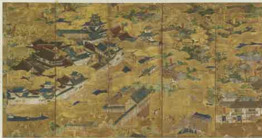
聚楽第図屏風(部分) 桃山時代 16世紀 東京・三井記念美術館蔵[後期]

2026年の大河ドラマ「豊臣兄弟!」は、「彼が長生きしていれば豊臣家の天下は安泰だった」とまで言わしめた豊臣秀長の目線で、戦国時代をダイナミックに描く物語です。本展覧会ではドラマと連動し、豊臣秀長と兄・秀吉、彼らをとりにまく織田信長、徳川家康、黒田官兵衛、藤堂高虎、千利休、高台院らゆかりの品々をはじめ貴重な歴史資料を紹介。兄弟の生き様、二人が駆け抜けた時代を浮き彫りにします。