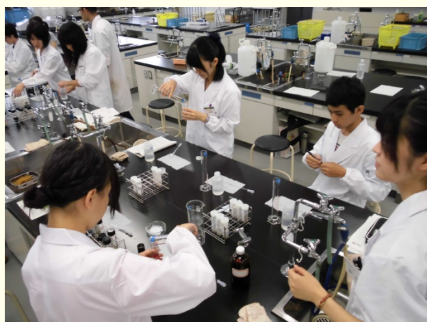
破碎・秤量した土への溶液の添加