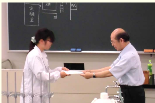
受講者への修了証書授与