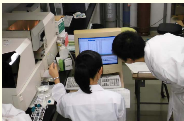
原子吸光光度計によるろ液のイオン濃度測定