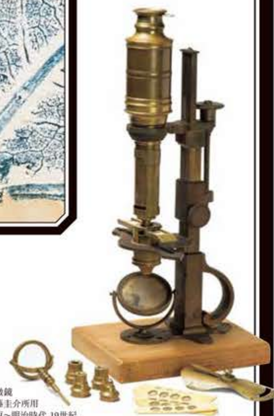
顕微鏡 伊藤圭介所用 江戸～明治時代 19世紀 名古屋市東山植物園蔵