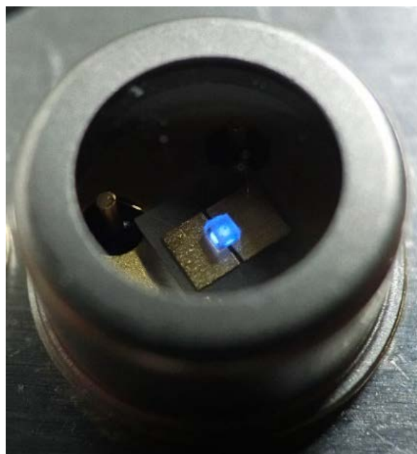
【参考画像】サファイア基板に作製された窒化アルミニウムガリウムLED

本研究成果は、米国物理協会（AIP）の科学誌「Applied Physics Letters」誌にて、2019年1月7日にオンライン公開されました。